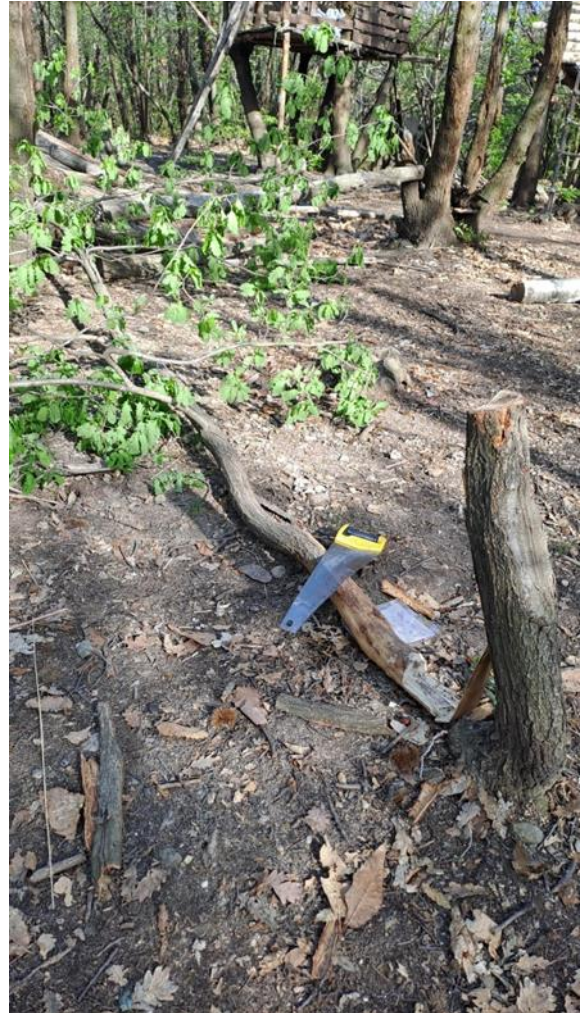
Bella quercia sana trovata tagliata in cima al Truc

insensibili di fronte alla delicatezza del luogo in cui si trovano e ai suoi viventi.