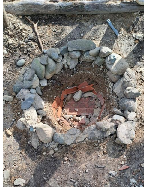
Abbiamo trovato questa base per fuoco sul Truc Bandiera, in mezzo agli alberi. Fortunatamente nessuno sembra averla utilizzata...