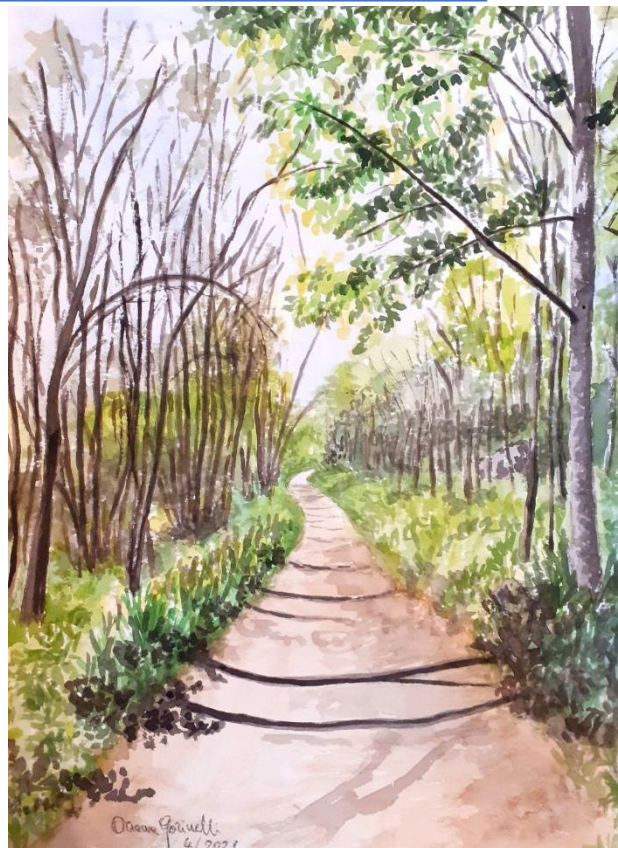
Acquerello di Oriana Gorinelli