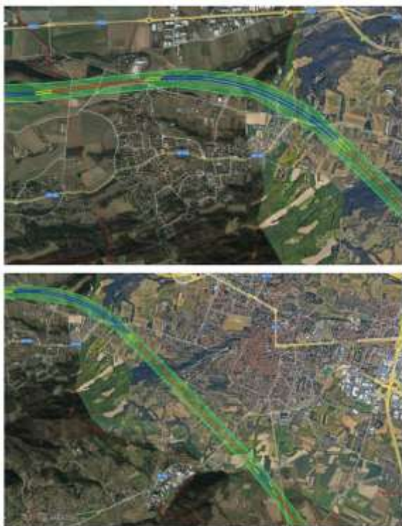
Previsione del passaggio TAV attraverso la Collina Morenica

Truc Bandiera è un gruppo, facente parte dell'Associazione Pro Natura Torino, costituito nell'anno 2014 da un centinaio di famiglie del territorio della Collina Morenica (Rivalta-Rivoli-Villarbasse) che hanno deciso di acquistare collettivamente, a nome di Pro Natura Torino Onlus, il bosco ceduo sul culmine di una delle tre colline simbolo di Rivalta di Torino, il Truc Bandiera.