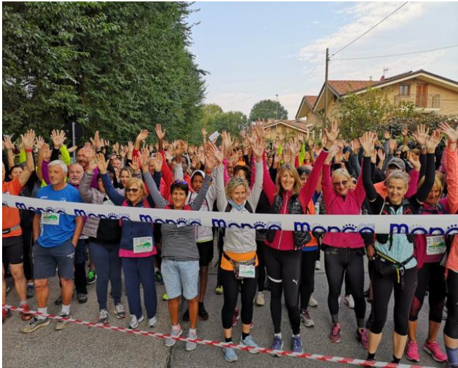
Fig. 3 – Partenza della 1° camminata in Collina Morenica

intagliati: tutto realizzato con centinaia di ore di lavoro da volontari e amici.