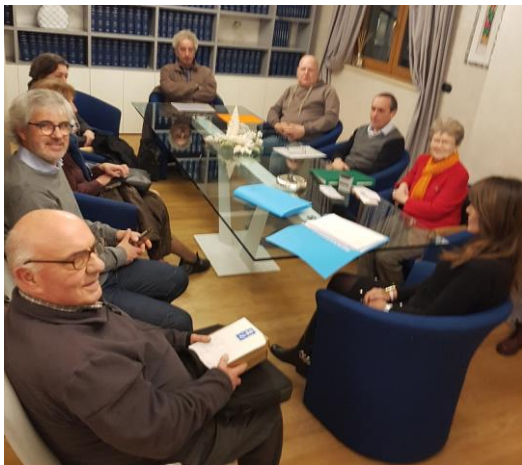
Fig. 1 – Atto notarile di acquisto dei nuovi terreni

12 Dicembre 2019 - Il Gruppo Truc Bandiera che nell'anno 2015 ha provveduto a far acquistare a Pro Natura Torino un appezzamento boschivo di 5.415 m2 situato sulla collina morenica rivaltese, bosco ceduo che in seguito è stato dapprima ripulito e quindi messo a disposizione di Gruppi, Associazioni, Scuole e singoli cittadini, ha proseguito nei suoi intenti con nuove e importanti novità.